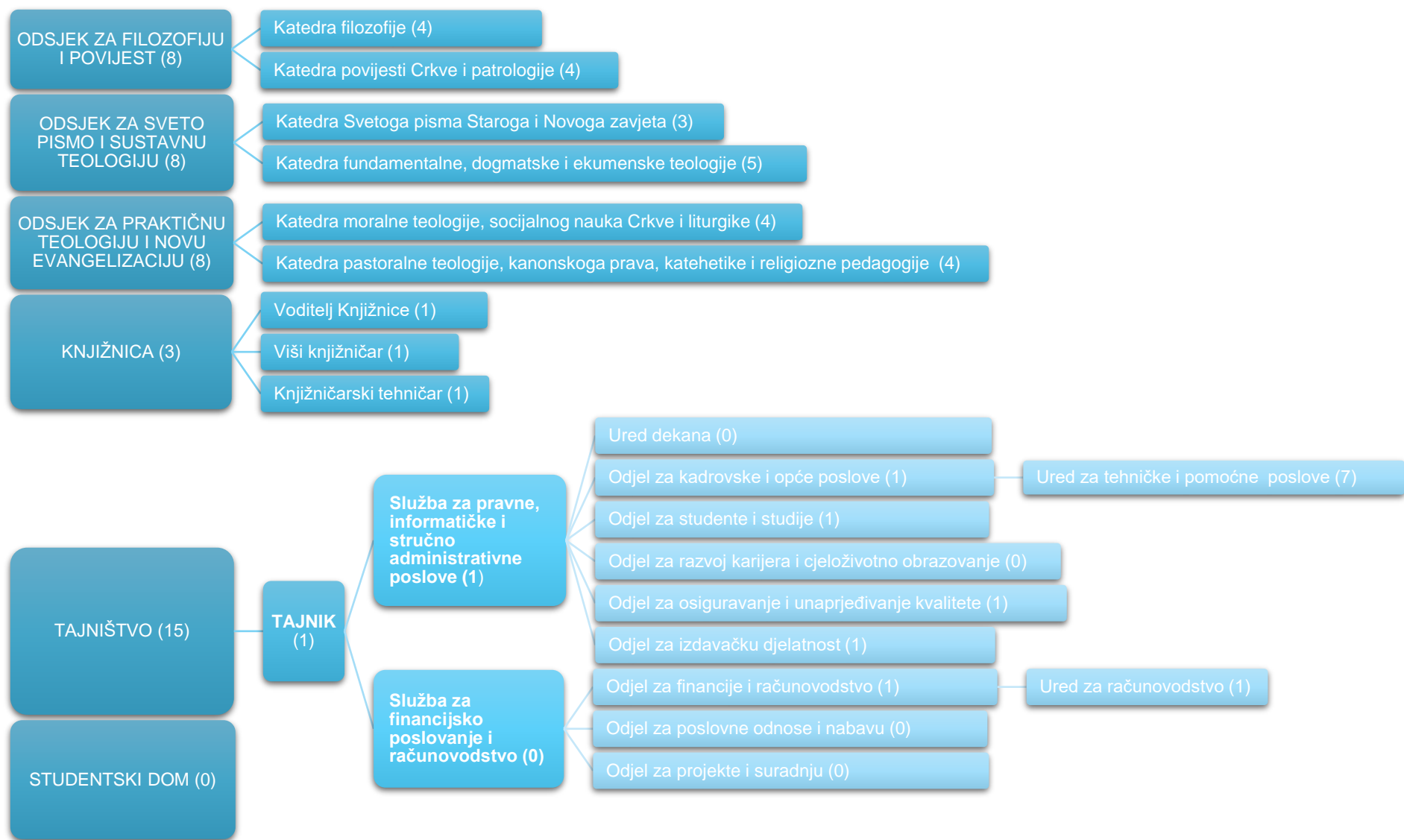
Slika B. Dijagram ustrojbenih jedinica Katoličkoga bogoslovnoga fakulteta u Đakovu (Odluka o ustrojstvu KBF-a u Đakovu u sastavu Sveučilišta J. J. Strossmayera u Osijeku u akademskoj godini 2024./2025. od 16. rujna 2024. godine